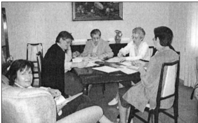
En pequeños grupos buscan soluciones.

Gran parte de la mañana la dedicaron a comentar algunos apartados de las Actas del Capítulo Provincial, en lo que se refiere a Misión Educativa y Pastoral Juvenil Vocacional. Tras una reflexión en pequeños grupos se subrayaron, en plenario, conclusiones muy importantes respecto a los «mensajes» que se habían descubierto y a las exigencias que la misión