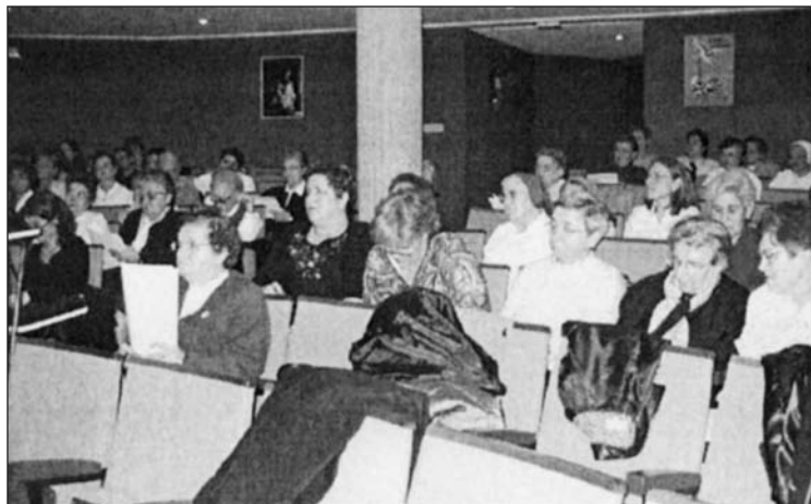
Siguen el tema con atención e interés.

Como recuerdo del encuentro dejó una serie de sugerencias: