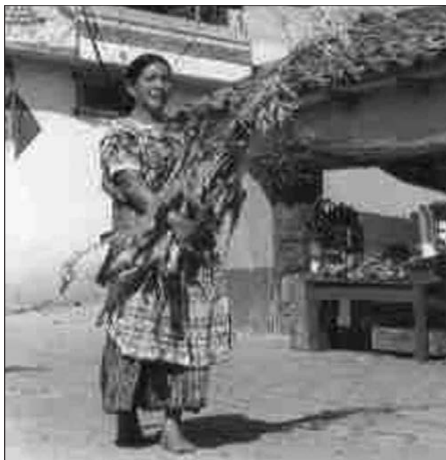
Mujer, pobre e indígena.

El tema estuvo motivado por un video; «La dignidad de la mujer» que ha editado el departamento de