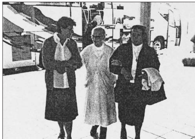
Un momento de la llegada.

En el mes de mayo se nos comunicó que el traslado, posiblemente, fuera en septiembre o en octubre y, para