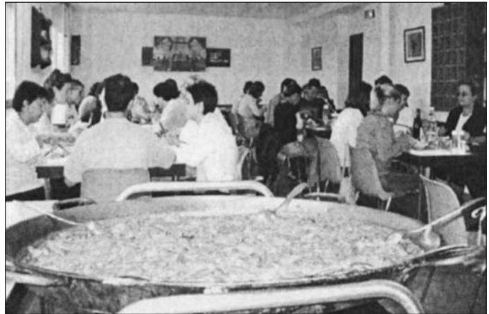
La «paella» seguramente animó la conversación de las jóvenes profesoras.

¿Qué escuela queremos? Fue otro de los interrogantes que el ponente planteó, sabiendo que «El futuro no hay que preverlo, sino crearlo».