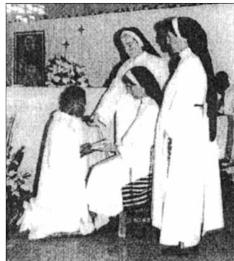
Hago a Dios en vuestras manos...

La disciplina, la cogida, la solidaridad y la gran fe en Cristo brota en cada cristiano de Larabia. Por eso, des-