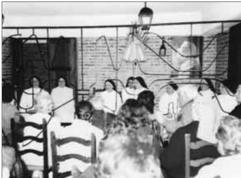
Reunidos en San Justo

compromiso con la espiritualidad dominicana anunciatista.