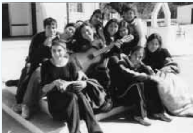
Los jóvenes misioneros de Villa Urquiza

En Villa Urquiza (Buenos Aires) tiene La Anunciata dos colegios: «Beata Imelda» y «Conservación de la