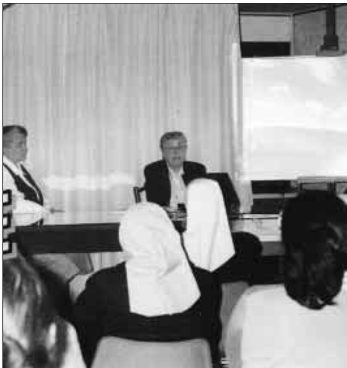
Despedida a la H. Carmen