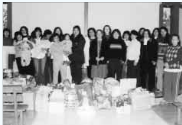
Todo para las bolsas solidarias