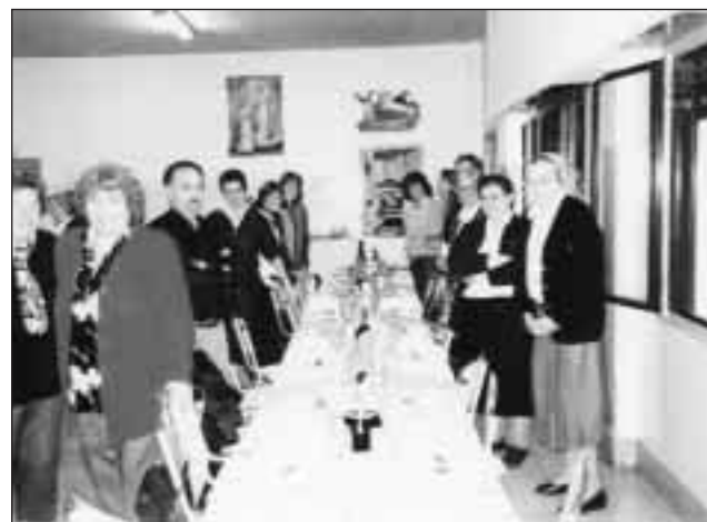
Al “mejor estilo Ramos Mejía” en su 90 Aniversario

* El día 8 del pasado mes de mayo, las hermanas compartieron, con el fervor de siempre, un momento intenso de espiritualidad con los laicos ( FRADA ): algunos renovaron y otros hicieron su