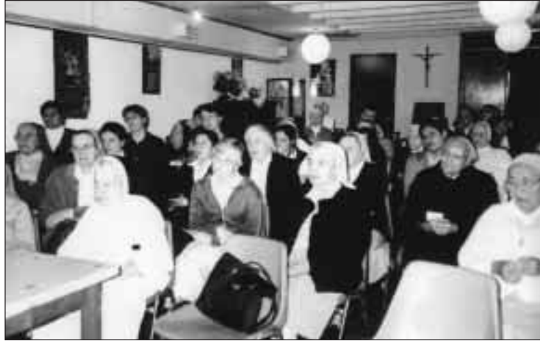
Quedaron informadas de los acontecimientos en la despedida de la H. Carmen

Todos los participantes salieron del encuentro felices de haber estado. Además de lo que refle-