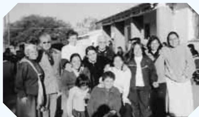
Uno de los grupos misioneros.