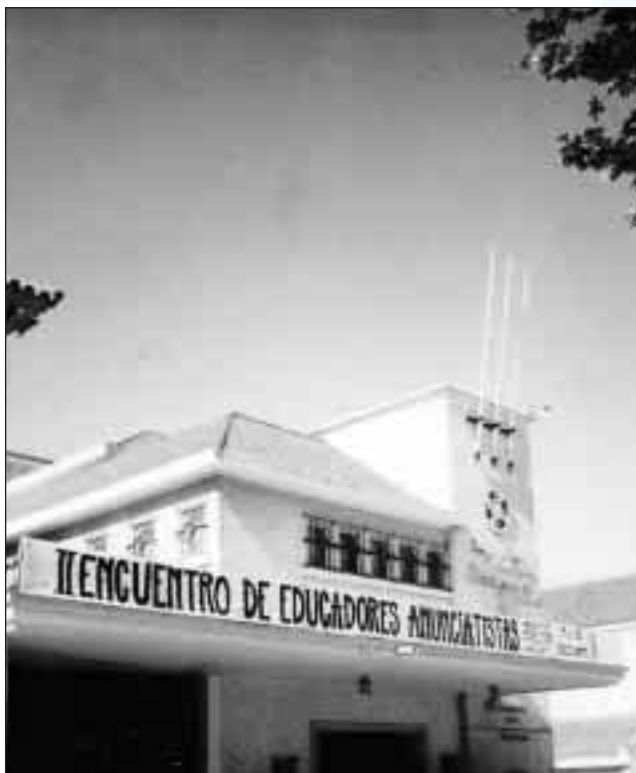
El lugar del Encuentro

Reflexionaron sobre 'el tiempo' como una clave para la educación. Es necesario cultivar un tiempo de silencio para que desde ahí surja la palabra. Existe el miedo de que el paso del tiempo robe la frescura y la firmeza y surge entonces la imitación del modelo joven y la inseguridad a corto plazo; por eso nuestros com-